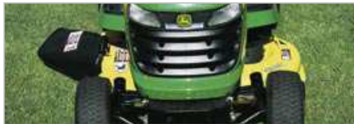
Výkonné třínožové žací ústrojí Edge s výhozem do boku.